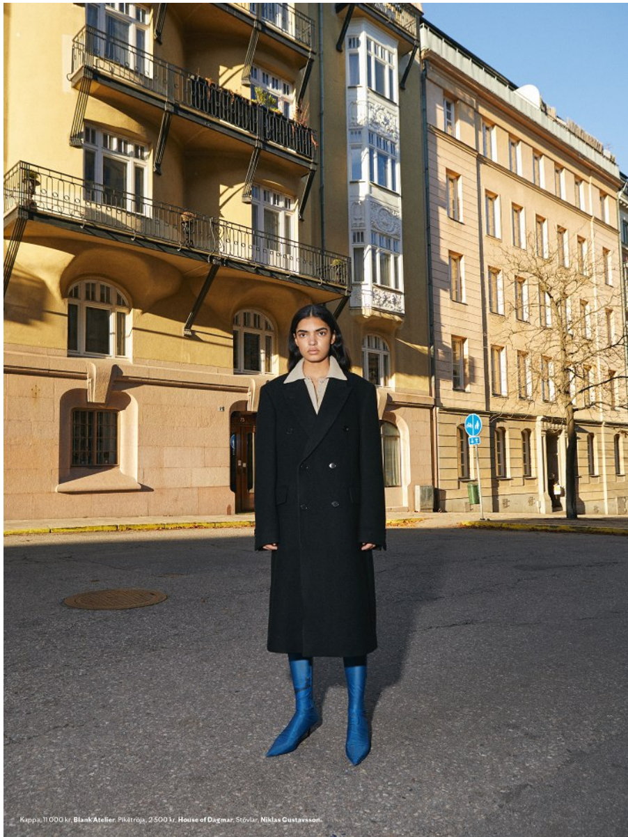
Kappa, 11 000 kr, Blank Åtaßer, Pikétröja, 2 500 kr, House of Dagmar, Stövlar, Niklas Gustavsson.