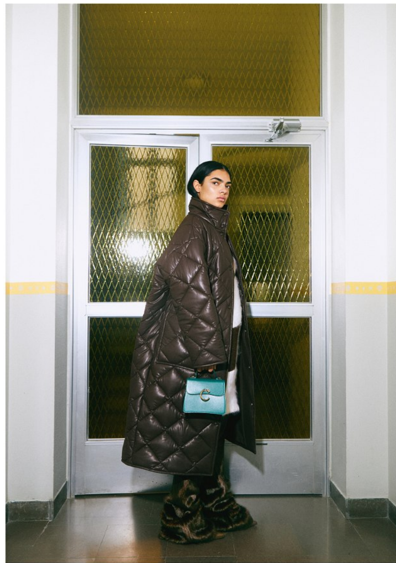
Kappa i läderimitation, 4 700 kr, Stand Studio. Klänning, Britta Åsaker Byxa i pälsimitation, Stand Studio. Väska, Panohère C de Cartier, 27 400 kr, Cartier.