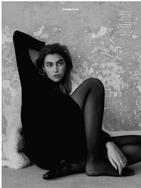
STREETWEAR El look es el elemento que define el estilo de una mujer. El look es el elemento que define el estilo de una mujer.