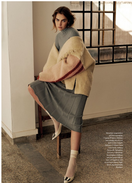
Mucho más que un pelo. El cabello es el elemento que define el estilo de una mujer. El cabello es el elemento que define el estilo de una mujer. El cabello es el elemento que define el estilo de una mujer.

Los vestidos de estampado Liberty de Loewe, a medio camino entre lo VICTORIANO y lo NEO BOHO, serán el ejemplo de sofisticación veraniega