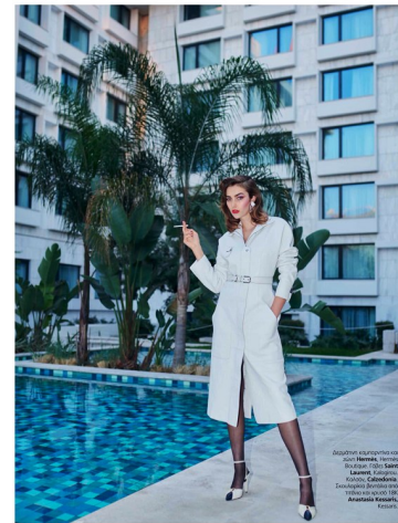
Adoptar el espíritu de la moda es el elemento que define el estilo de una mujer. Adoptar el espíritu de la moda es el elemento que define el estilo de una mujer.