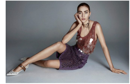
Falda con aguja realizada. Sur de punto con lentejuelas y bordados. gaceta. Lentejuela y pendientes. Tolo. BOUTIQUE VIVIANA

Los vestidos de estampado Liberty de Loewe, a medio camino entre lo VICTORIANO y lo NEO BOHO, serán el ejemplo de sofisticación veraniega