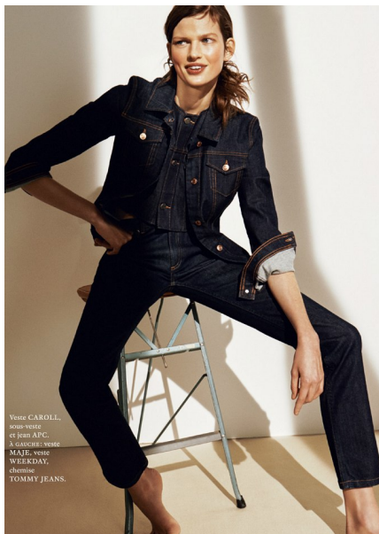
Veste CAROLL, jeans vestes et jean APC, à manchet, veste MAJE, veste WEEKDAY, chemise TOMMY JEANS