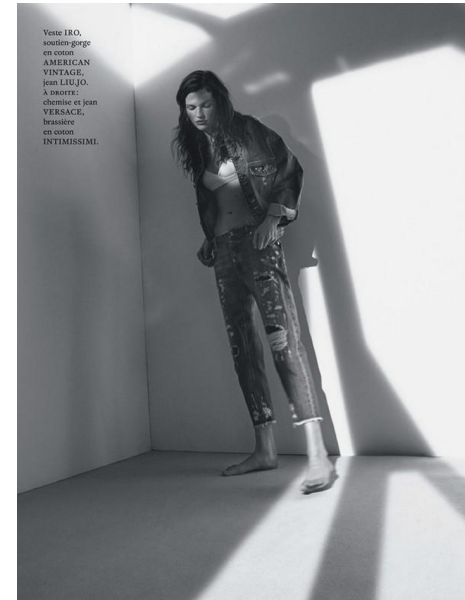
Veste IRO, hooded-gorge en cooton AMERICAN VINTAGE, jean LIU JO, à manchet chemise et jean VERSACE, brassière en cooton INTIMISSIMI.