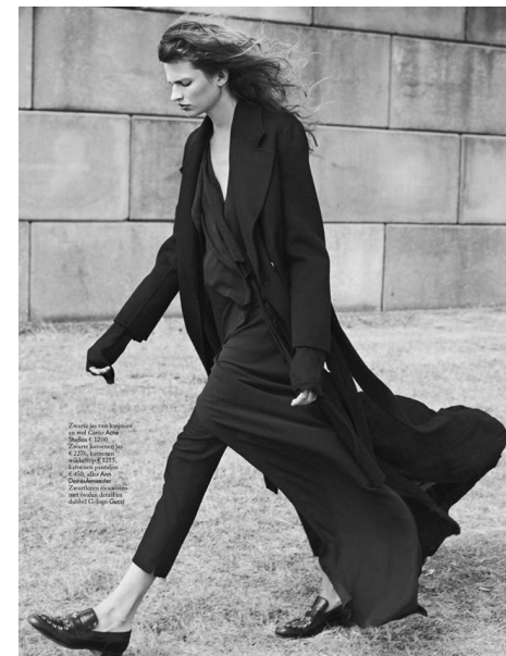
Zwarte juze met hooded-gorge en cooton AMERICAN VINTAGE, jean LIU JO, à manchet chemise et jean VERSACE, brassière en cooton INTIMISSIMI.