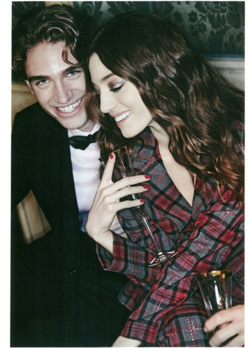
Per lui: abito monospetto di lana, camicia e papillon, tutto GIORGIO ARMANI . Per lei: giacca e pantaloni tulle, RINASCIMENTO . Pagine accanto, da sinistra: completo scuro e blazer nero monospetto, tutto RINASCIMENTO . Occhiali della collezione Lumiere Diamanti d'oro giallo e Villano , MANICO BOSCO . Mini abito di velluto lustrato oro, THE ATTICO .